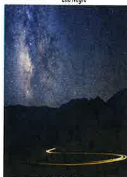
Camps des Fourches