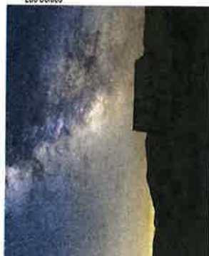
Camps des Fourches