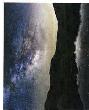
Lac de Prals