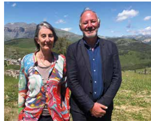
E. Gastaud / PnM