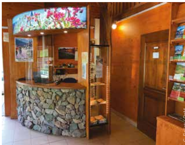
G. Ballet / PnM