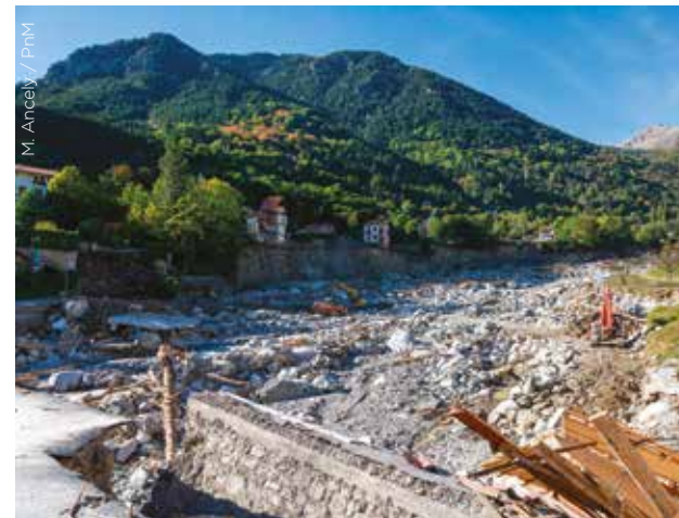
M. Ancely / PnM