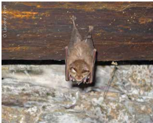
O. Laurent / PnM