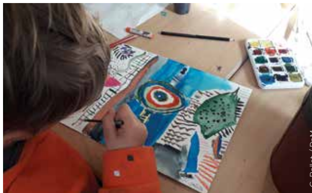
G. Ballet / PnM