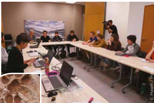
E. Maselli / PnM

Ce programme pédagogique, mené depuis 3 ans, a pour objectif d'enseigner aux élèves les différents aspects du développement durable par le biais d'actions de terrain et en utilisant le formidable outil que constitue le Parc national du Mercantour. Il vise aussi à développer chez eux des valeurs citoyennes (responsabilités individuelle et collective, solidarité, respect d'autrui et de l'environnement), qu'ils auront ensuite la responsabilité de diffuser autour d'eux. Si le projet a souffert ensuite des effets du confinement, les partenaires reprendront le flambeau de ce beau projet dès 2021 !