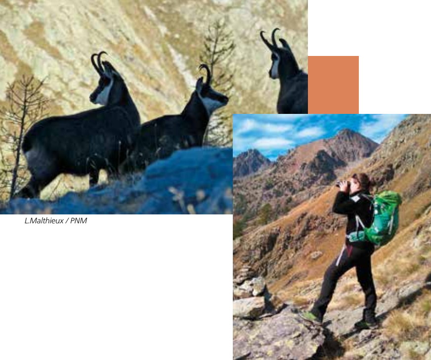
L.Malthieux / PNM