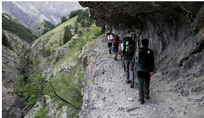
↑ station météo montée, en haut - portage du matériel, en bas