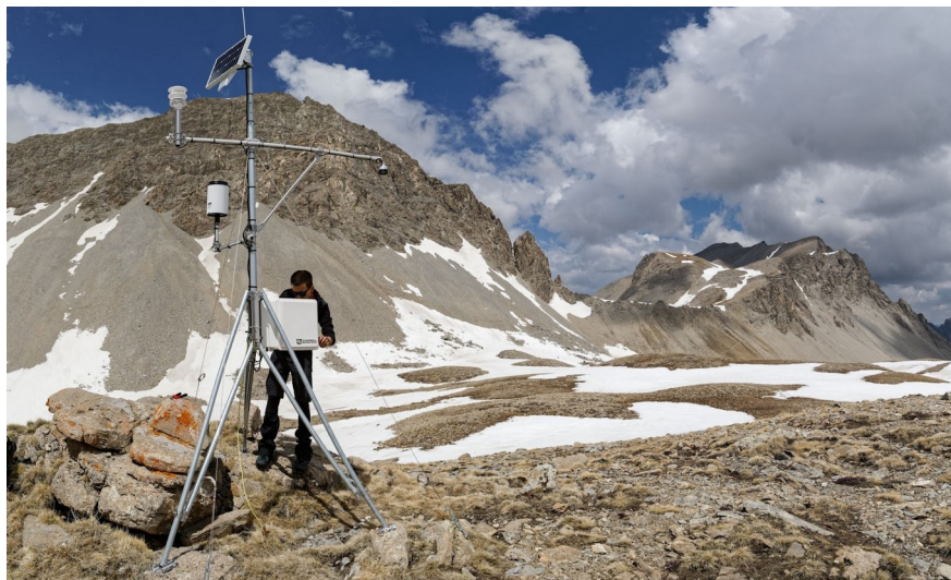
↑ récupération des données de la station météo de la Grande Cayolle, en mai 2022

Site internet du PNM : http://www.mercantour-parcnational.fr/fr