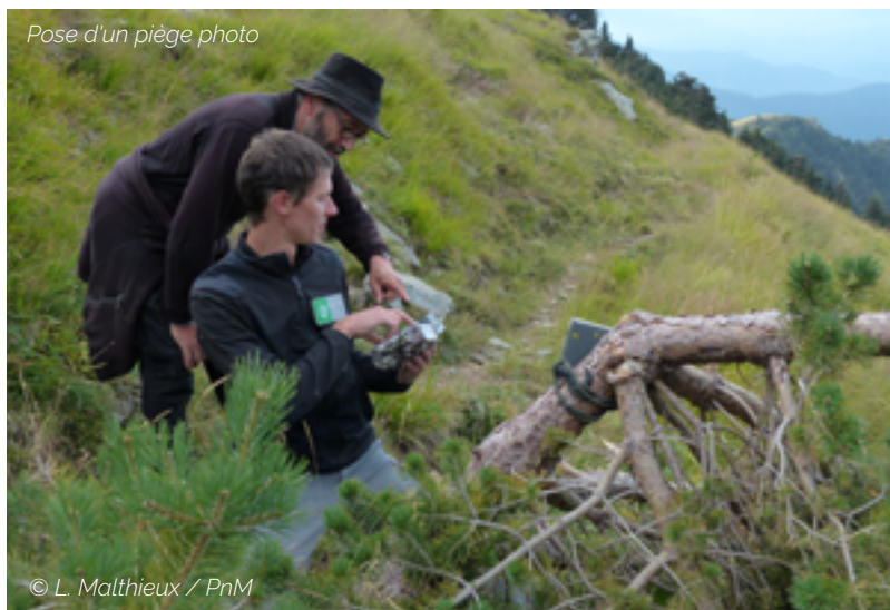
Pose d'un piège photo

En tant qu'établissement public et gestionnaire d'un espace naturel protégé, le Parc est impliqué dans des programmes de suivi et de conservation interparcs, nationaux et internationaux. Ces programmes s'appuient sur un nombre important de sites de référence et sur des protocoles de suivi standardisés garantissant ainsi la fiabilité des résultats. Ces réseaux permettent également l'échange d'expérience indispensable et la mise en cohérence des actions de conservation. C'est pourquoi, le Parc continuera à s'inscrire dans les grands réseaux de connaissance et de suivi. Au regard des moyens humains en baisse, la priorité est d'abord de maintenir la participation dans les réseaux dans lesquels le Parc est déjà engagé (Observatoire des Galliformes de Montagne, Réseau Loup, Vulture Conservation Fondation, Oiseaux d'Altitude, Observatoire Rapaces LPO, sentinelles des Alpes, RESEAU D'Acteurs pour la conservation de la flore méditerranéenne, Plan Régional d'Actions pour les Chiroptères, Espèces Végétales Exotiques Envahissantes). Le Parc étudiera aussi la possibilité d'inscrire les suivis réalisés actuellement de manière isolée dans des démarches partagées. Comme précisé précédemment, l'objectif du Parc est la réalisation de cartes de répartition plutôt que la mise en place de nouveaux suivis ponctuels. Mais si de nouveaux suivis étaient envisagés, la priorité serait donnée aux démarches portées par l'OFB.