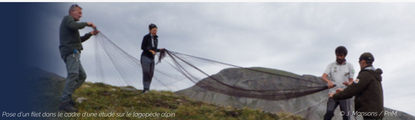
Pose d'un filet dans le cadre d'une étude sur le lagopède alpin