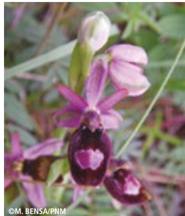
Ophrys de Bertoloni

La flore est également très diversifiée avec 1 126 espèces présentes sur le territoire communal. Tous les milieux représentés sur la commune hébergent des espèces patrimoniales qu'il faut préserver. Le très rare ophrys de Bertoloni, une orchidée, s'épanouit dans les milieux ouverts méditerranéens. La centaurée des Alpes trouve ici sa seule station connue en France, dans les falaises calcaires du mont Cuore. Des espèces endémiques, c'est-à-dire très localisées, sont également présentes comme le cytise d'Ardoino, la gentiane de Ligurie ou encore l'euphorbe de Canut.